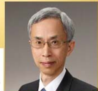
西森 秀稔 教授